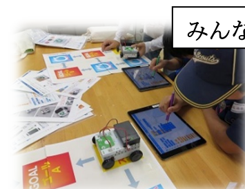
ロボットをプログラミング