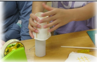
コップでロケット