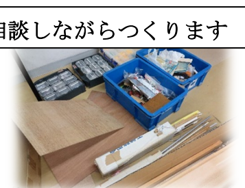
いろいろな材料を使います

会 場 : 岡山市立西大寺公民館 〒704-8115 岡山市東区向州 1-1 電話 : 086-942-6252 費 用 : 年間 1,000 円 (傷害保険料を含む) 日 時 : 毎月第 2・4 土曜日 10 時~12 時 (夏休み中は毎週) (都合で変更あり) 対 象 : 令和 8 年度 小学校 4・5・6 年生 定 員 : 30 名程度。応募者が多い時は、パソコン抽選をします。 クラブには入れる人には、3 月 13 日 (金) までに案内はがきを発送します。