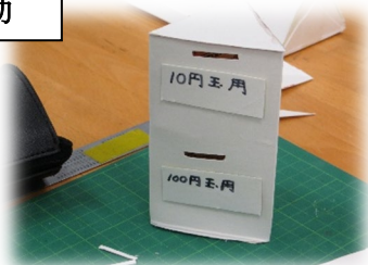
牛乳パックで貯金箱