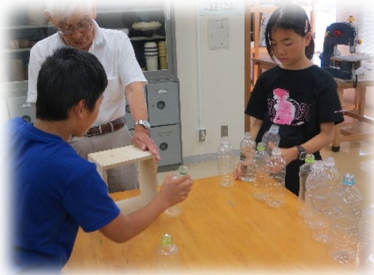
どのように作るか相談します