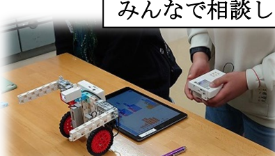
ロボットをプログラム