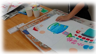
アイデアを絵にします