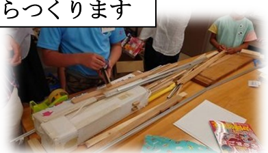
いろいろな材料を使います