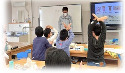
外部講師の講座も