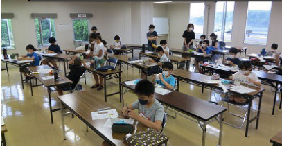
コロナ対策でひろびろ会場