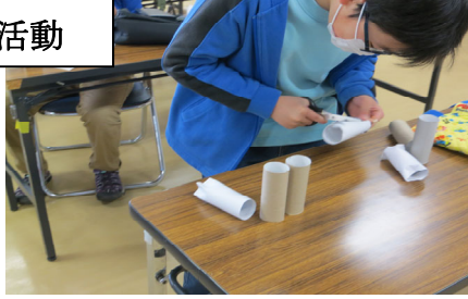
トイレットペーパーの芯で何が・・・