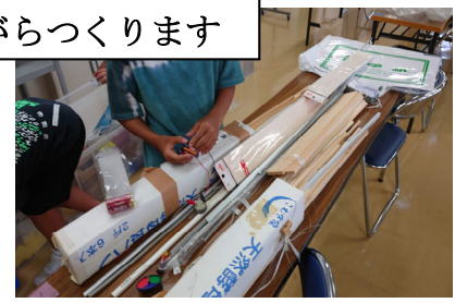
いろいろな材料があります