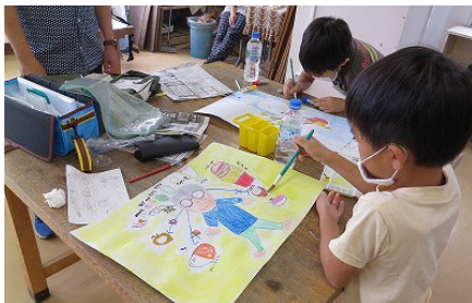
アイデアを絵にします