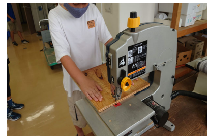
いろいろな工作機械も使って作ります