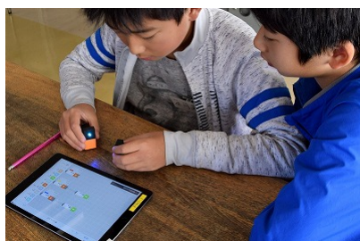
タブレットも使用